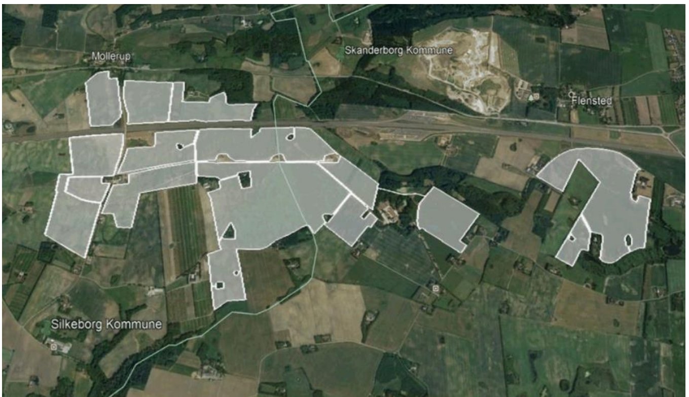
Mollerup Laven Solcelleanlæg