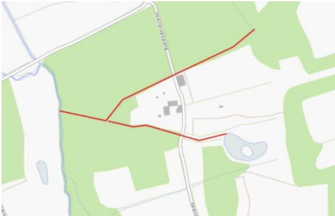
Resenbro - Skellerup Bæk vandløb