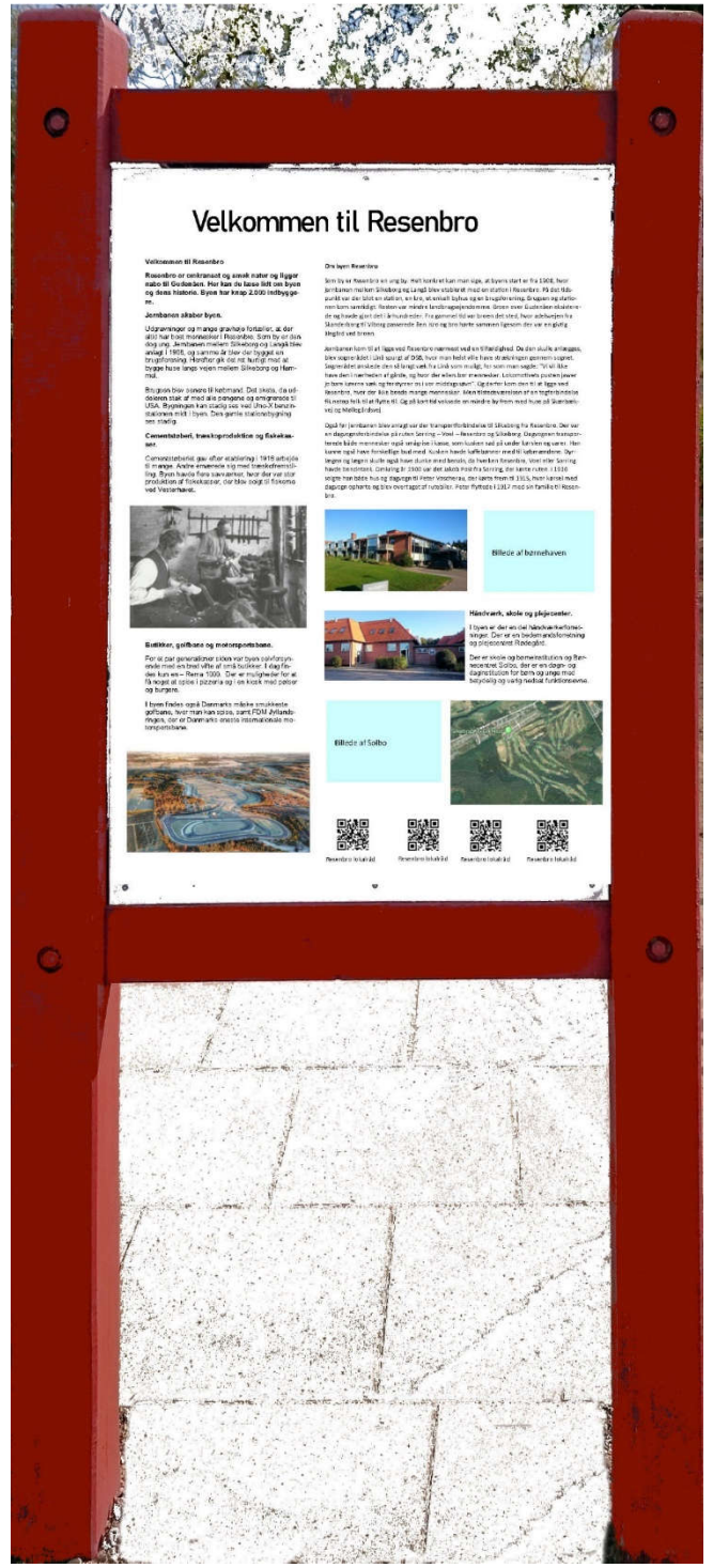
Resebro-infostanderen på det grønne område ved bord/bænkesættet til Voel-siden